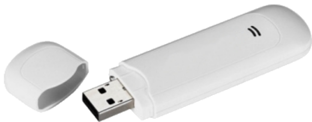
USB Flash Modem HUAWEY E-1550

HSDPA модем Huawei E1550 представляет собой миниатюрный скоростной беспроводной 3G модем с USB интерфейсом и устройство для чтения карт памяти microSD. В 3G UMTS сетях с поддержкой технологии HSDPA Huawei E1550 поддерживает получение данных на скорости до 3,6 Mbps и передачу данных на скорости до 384 kbps.