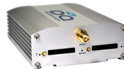
Multi-SIM MC35i - 2 GSM/GPRS Terminal

Имеет выносную внешнюю антенну. Для работы необходима SIM-карта сотового оператора.