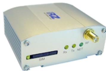
IRZ MC-35pu Terminal

Компактный и легкий GSM/GPRS-терминал IRZ MC35pu, построенный на базе модуля MC39i, предназначен как для обеспечения мобильного доступа в Интернет, так и для решения задач в области телеметрии и телесервиса. Модем работает в режиме постоянного подключения, поддерживает диапазоны GSM 900 и 1800 МГц и обладает возможностями голосовой связи, высокоскоростной беспроводной передачи данных, приема и передачи SMS и факсов. Основной отличительной особенностью модема IRZ MC35pu является отсутствие внешнего питания: достаточно подключить антенну и USB-кабель, установить SIM карту и терминал готов к работе. Двойной USB кабель обеспечивает достаточный уровень электропитания. MC35pu оснащен сторожевым таймером, что позволяет модему всегда оставаться на связи.